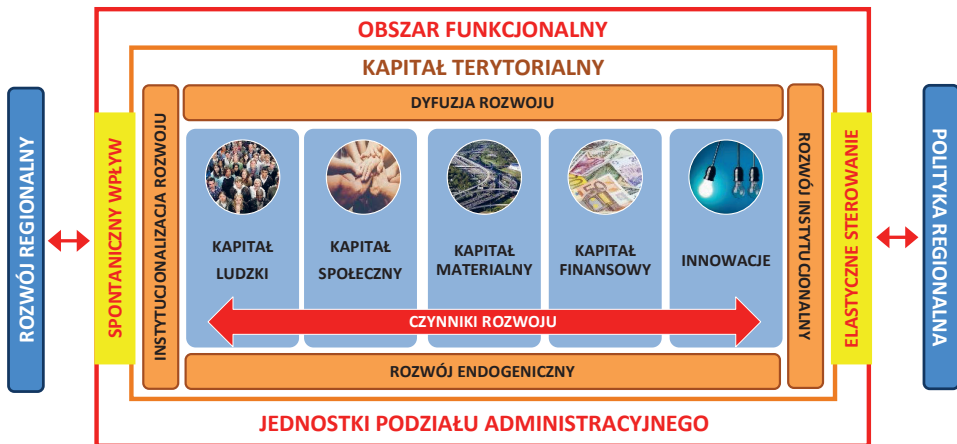
Rys. 1. Model operacyjnej konkretyzacji czynników rozwoju w implementacji polityki rozwoju zorientowanej terytorialnie

pragmatycznych, w granicach jednostek administracyjnych (rys. 1). Zakłada się, że określenie czynników rozwoju regionalnego wymaga identyfikacji ich składowych na najniższym możliwym poziomie terytorialnym regionu, na którym tworzą one środowisko dla życia mieszkańców i prowadzenia działalności gospodarczej. Od nich zależy bowiem poziom i warunki życia mieszkańców regionów oraz jego atrakcyjność jako miejsca lokalizowania i prowadzenia działalności gospodarczej. Czynniki rozwoju regionu traktuje się bowiem jako wypadkową czynników rozwoju jego terytoriów składowych, adaptując na poziom regionalny obowiązujące od przełomu XX i XXI wieku panujące na gruncie polityki regionalnej przeświadczenie, że rozwój obszarów większych jest efektem synergii rozwoju ich składowych, a nie odwrotnie. Fundamentem niniejszej propozycji jest, nawiązująca do założeń teorii rozwoju endogenicznego, koncepcja kapitału terytorialnego, który postrzega się jako bazy dla rozwoju każdego obszaru [Camagni, 2008].